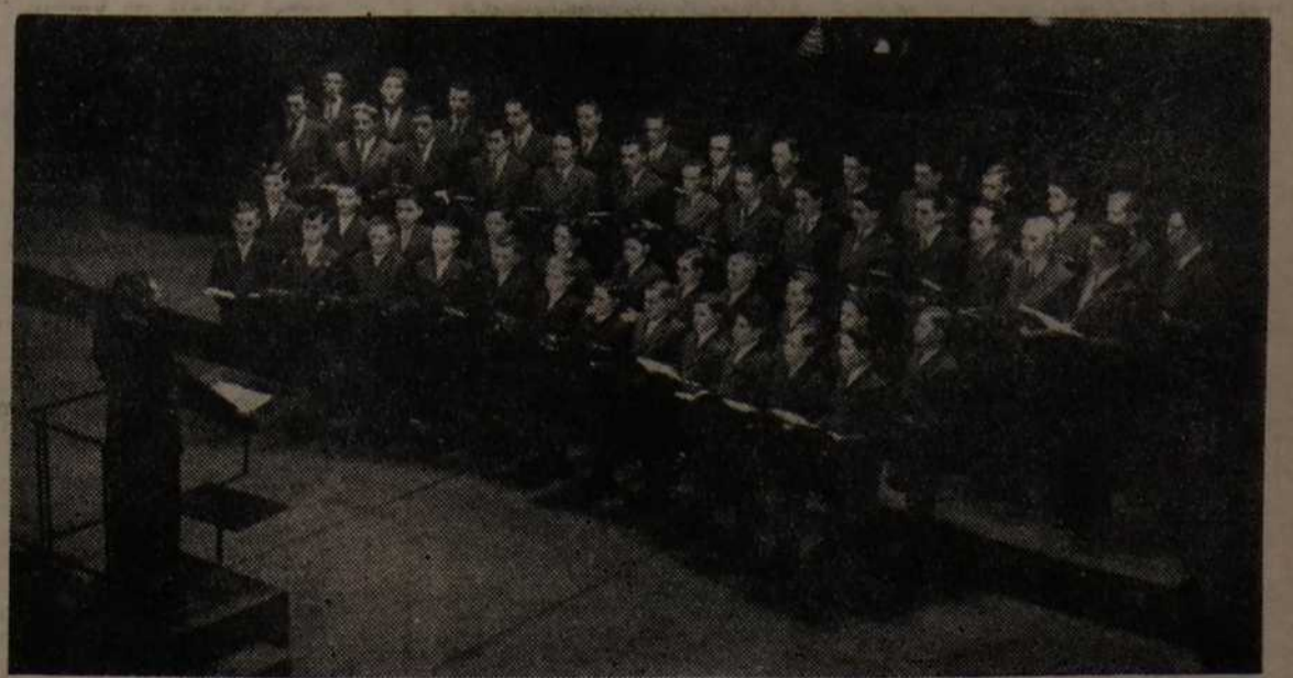
A marosvásárhelyi gimnázium és tanítóképző énekkara