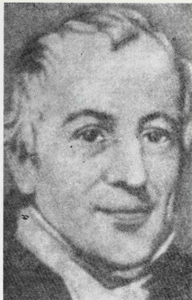
(A politikai gazdaság és az adózás a lapelvéiről). (Sz. 1772. április 19. L.)

— 150 éve, 1823-ban Londonban halt meg David RICARDO angol közgazdász és politikus, a polgári klasszikus közgazdaságtan legkiválóbb képviselője. Több kiadásban és fordításban is megjelent műve On the Principles of Political Economy and Taxation . L 1817